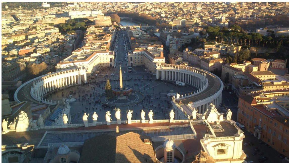
Pohled z baziliky svatého Petra - Berniniho náměstí s obeliskem

Řím (Roma, přezdíváný též Věčné město ) je hlavní město Itálie, oblasti Lazio a provincie Roma. Leží na řece Tibeře, asi 27 km od pobřeží Středozemního moře.